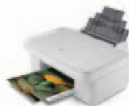
Epson Stylus DX3800

Nie jest ważne, czy tworzysz kolorowe projekty szkolne, drukujesz strony internetowe, czy drukujesz swoje zdjęcia w domu, tusze DURABrite Ultra zapewnią oszałamiające wydruki. Dzięki tuszom DURABrite Ultra Twoje wydruki pozostaną żywe przez wiele kolejnych lat. Tylko firma Epson oferuje tusze DURABrite Ultra. Tylko tusze DURABrite Ultra potrafią wszystko.