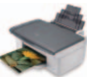
Epson Stylus DX4200

Nie wszystkie modele są dostępne we wszystkich krajach. W celu uzyskania szczegółowych informacji prosimy o kontakt z lokalnym oddziałem firmy Epson.