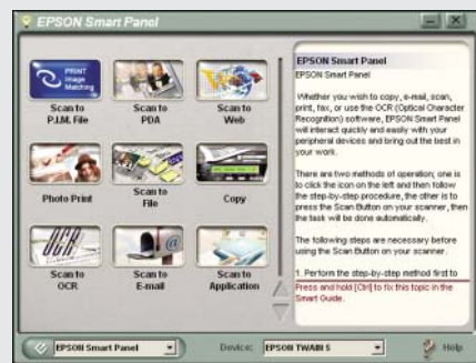
EPSON Smart Panel