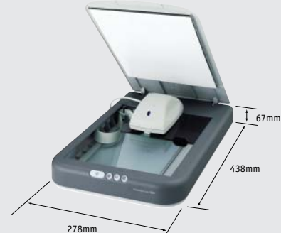
EPSON Perfection 1260 Photo

*EPSON PRINT Image Matching™ (P.I.M.) to idealna technologia pozwalająca na skanowanie wszystkich typów filmów barwnych oraz uzyskiwanie jaskrawszych i bardziej żywych odbitek, w połączeniu z drukarką EPSON, wykorzystującą technologię P.I.M.