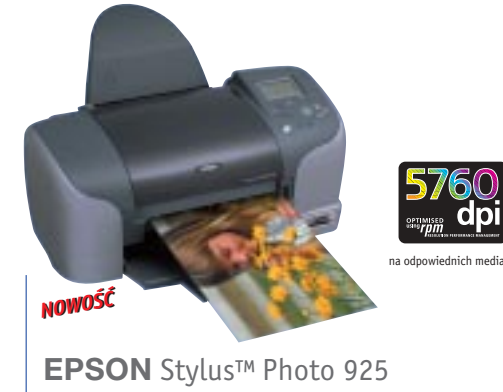
EPSON Stylus™ Photo 925

** 1. adapter kart Compact Flash, 2. adapter kart Smart Media, Memory Stick, karta SD, karta MME