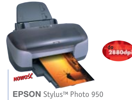
EPSON Stylus™ Photo 950

*** Compact Flash, Smart Media, Memory Stick, IBM Microdrive (gniazdo dostępne w urządzeniu); za pośrednictwem adaptera (dostępne opcjonalnie) drukarka jest kompatybilna z kartami SD oraz MME.