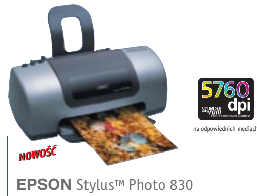
EPSON Stylus™ Photo 830

Wydajna drukarka fotograficzna dla całej rodziny i na każdy dzień.