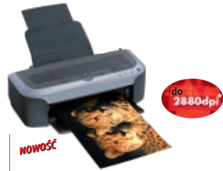
EPSON Stylus™ Photo 2100