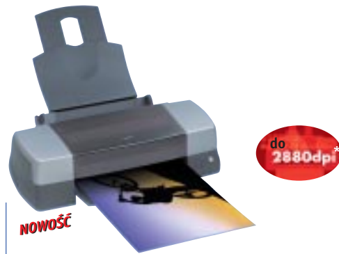
EPSON Stylus™ Photo 1290S

Wspaniała drukarka fotograficzna w wersji srebrnej – bezmarginesowy wydruk na formatach do DIN A3+.