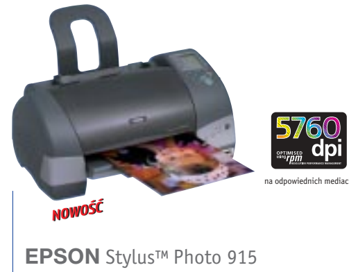
EPSON Stylus™ Photo 915

Drukarka 6-kolorowa dla wszystkich cyfrowych aparatów fotograficznych – wspaniałe zdjęcia automatycznie, bez pomocy komputera.